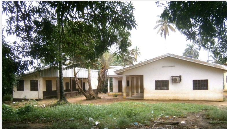
Foto del actual Centro de Salud en desuso