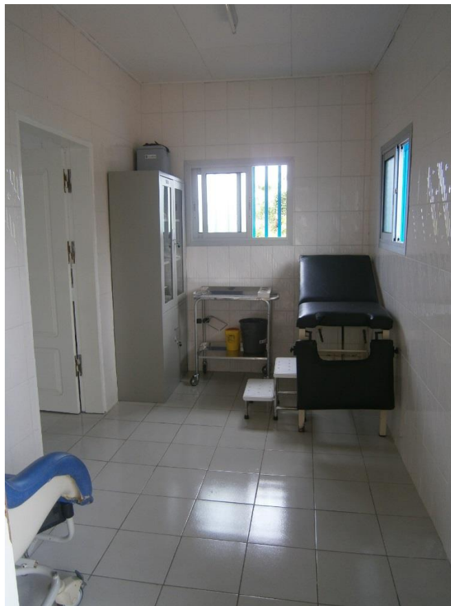
Foto 15. Sala de curas de enfermería