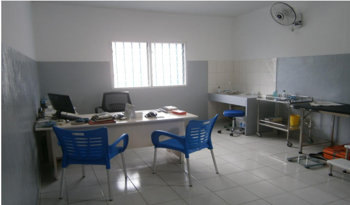
Foto 12. Consulta del médico edificio 1