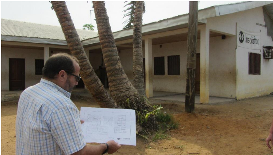
Foto 1. Estado del Centro de Salud previo a la rehabilitación – vista exterior