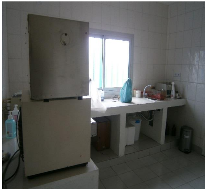
Fotos 7, 8, 9, 10y 11. Área de laboratorio/extracciones: rehabilitación y estado actual