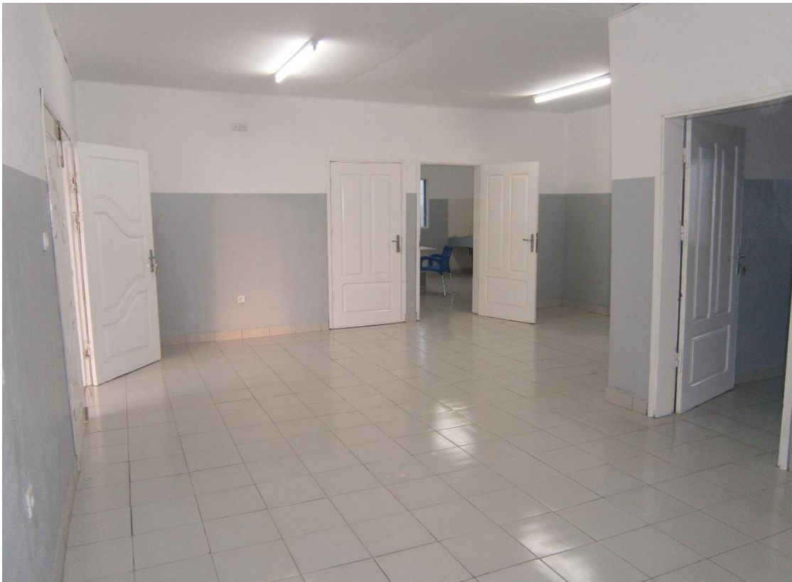
Foto 17. Distribuidor del edificio 1