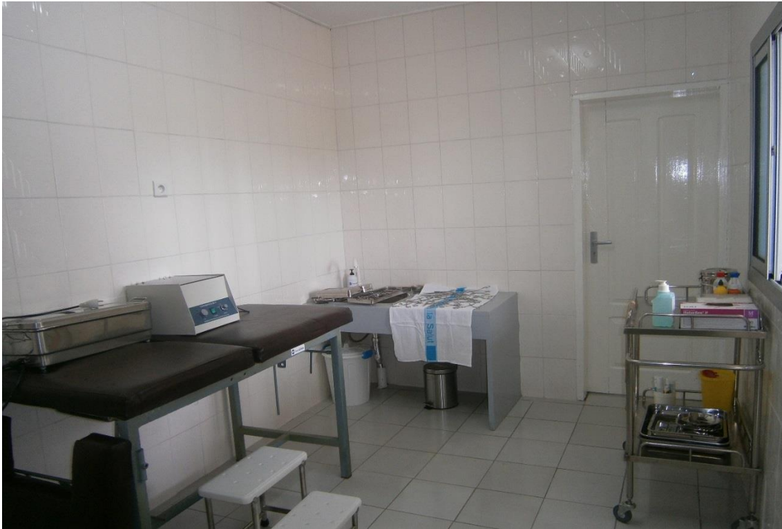
Foto 14. Área de esterilización de material sanitario