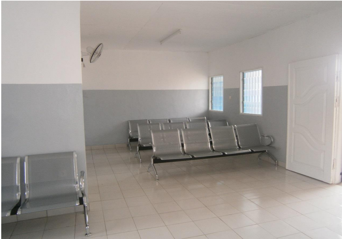
Foto 16. Sala de espera, 2017