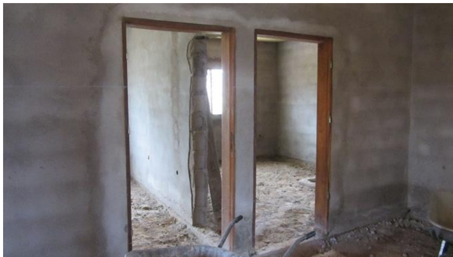
Foto 3. Estado del Centro de Salud previo a la rehabilitación – interior