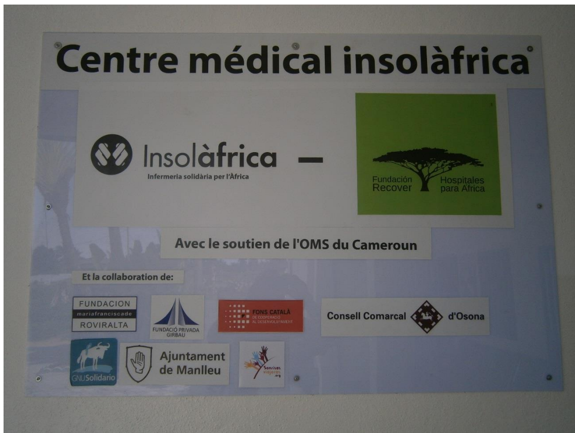
Foto 19. Colaboraciones Centro de Salud Integral de Kribi