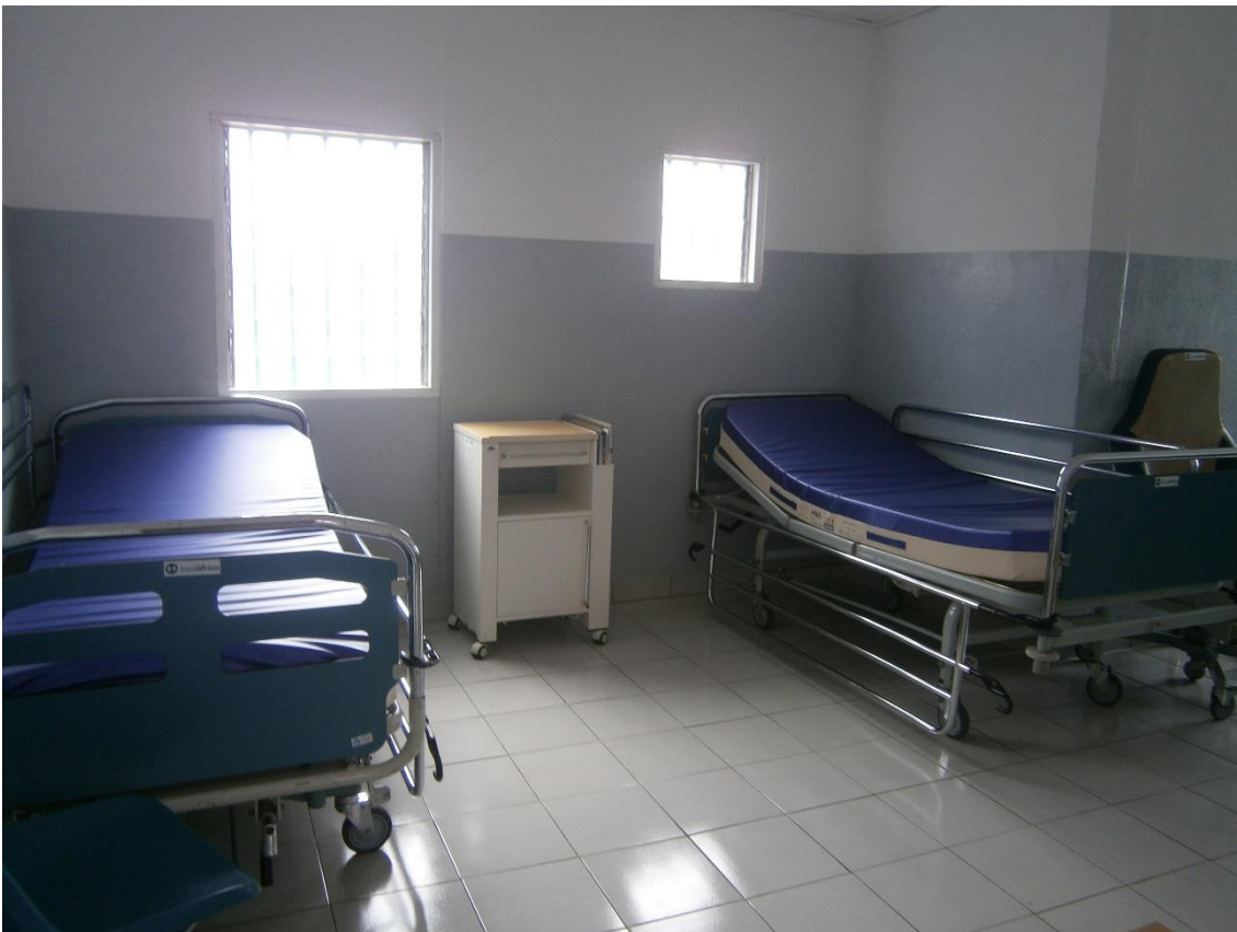
Foto 13. Área de hospitalización