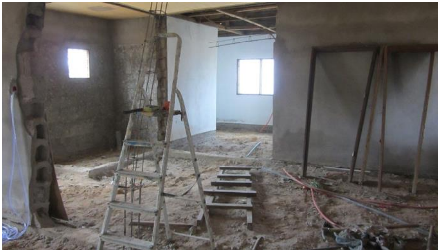
Foto 2. Estado del Centro de Salud previo a la rehabilitación – interior